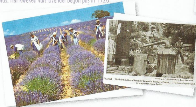
FIGURE 3 Field distillation of lavender flowers in Southern France. The steam is generally in a separate steam boiler.

La lavande a toujours poussé naturellement sur le plateau des gras, c'est vers 1920 que les hommes ont commencé à la cultiver. Lavender has always naturally grown on the Plateau de Gras, around 1920 year men began to cultivate it / Der Lavendel ist auf dem Plateau des gras immer natürlich gewachsen; erst um 1920 herum haben die Menschen angefangen, ihn zu kultivieren. De natuurlijke groeiwijze van Lavendel heeft altijd bestaan op de vlaktes van het stadje Gras. Het kweken van lavendel begon pas in 1920