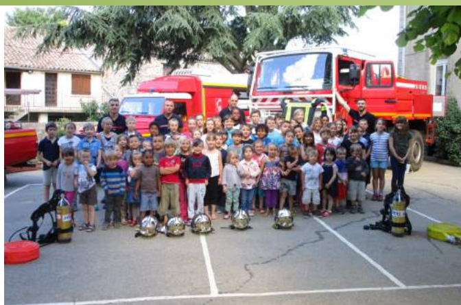
Intervention par deux fois des pompiers à l'école dans le cadre d'activités pédagogiques : apprentissage aux premiers secours, exercices de confinement et d'évacuation.