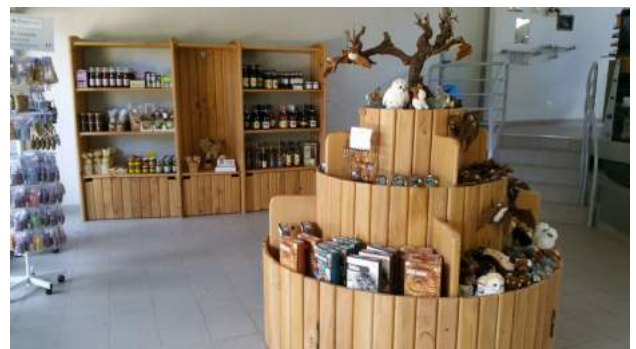
Grotte de la Madeleine : réaménagement complet de la boutique qui permettra un espace de vente plus spacieux (travaux réalisés par la menuiserie Christophe Jaquin à Saint Remèze.).