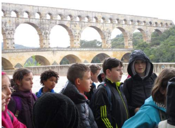
Dans le cadre de leur programme d'histoire, 39 élèves ont visité le Pont du Gard et son musée le 9 mai dernier.

La Mairie a investi 3500 Euros HT pour équiper les classes de CE2, CM1 et CM2 d'un tableau numérique qui sera fonctionnel dès la rentrée prochaine, ainsi que quatre ordinateurs portables qui viennent s'ajouter au parc informatique actuel.