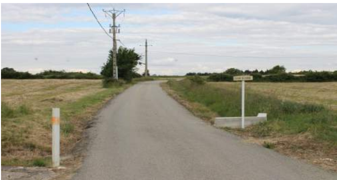
Chemin du champ de Lierre: Construction d'un ouvrage pour canaliser et dévier les eaux de ruissellement