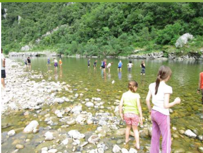
Classe verte à Gaud les 3 et 4 juin : atelier chauve-souris, oiseaux, forêt, land-art et faune de la rivière.