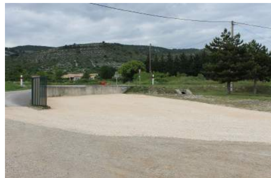
Réaménagement de la zone de tri au Touroulet, celle-ci étant devenu impraticable