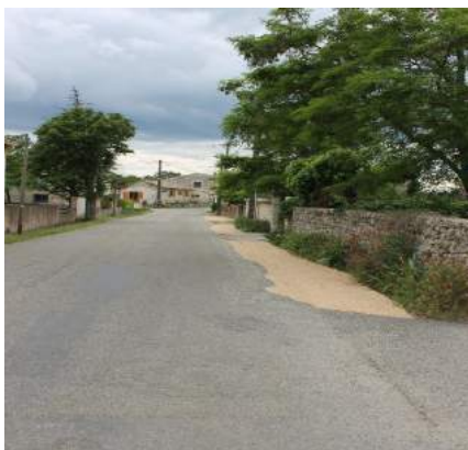
Route des Gorges : création d'un bas-côté