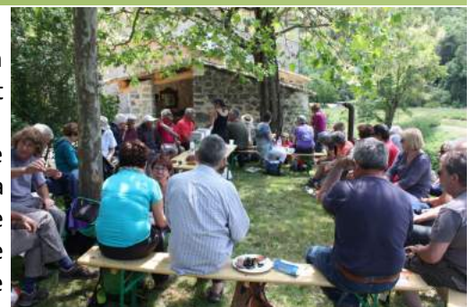
Fête du pain à Micalin

L'association envisage de diversifier ses activités. Elle proposera une Nuit des Etoiles en août, une course d'orientation « autrement » à l'automne, une nouvelle Journée Pierre sèche, sans oublier la Journée Espaces naturels au Cirque de Gaud début septembre et la castagnade le 21 octobre. Elle s'engage aussi dans un partenariat avec La Maison de l'Image pour la projection de films sur l'environnement. Son bulletin « la Feuille de Vigne » sortira très prochainement avec un article sur les chèvres.